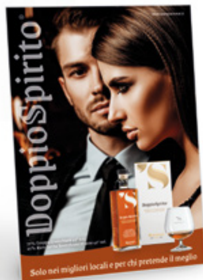
Carta degli Spiriti

Il Menu con la selezione dei prodotti Mantovani